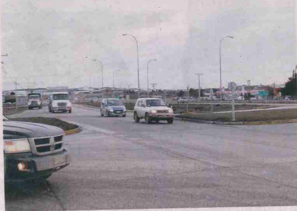
La Dirección Regional de Vialidad repintará y recuperará las señales de tránsito en la Ruta 9 Norte, hasta el kilómetro 160.

Francisco León Ponce periodistas@elpinguino.com