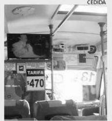
PASAJEROS PUEDEN VER TV.